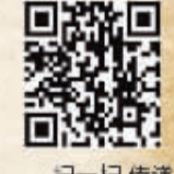
扫一扫，传递“抗战胜利之火”

南京沦陷之后，成为侵华日军的中枢和汪伪政权的统治中心。为了抗日侵略者，新四军在南京地区开展了游击战争。新四军江南部队东进后的第一站，就是到南京的郊区高淳，打的第一个胜仗就是南京郊外的丁桥战斗。新四军第一、第二支队就活动在南京郊区。新四军在南京周边地区开展频繁的游击战争，取得了一次次胜利；在江宁、高淳、溧水、江浦、六合等地相继建立起一个个抗日根据地，形成了对日伪盘踞的南京城的战略包围态势。