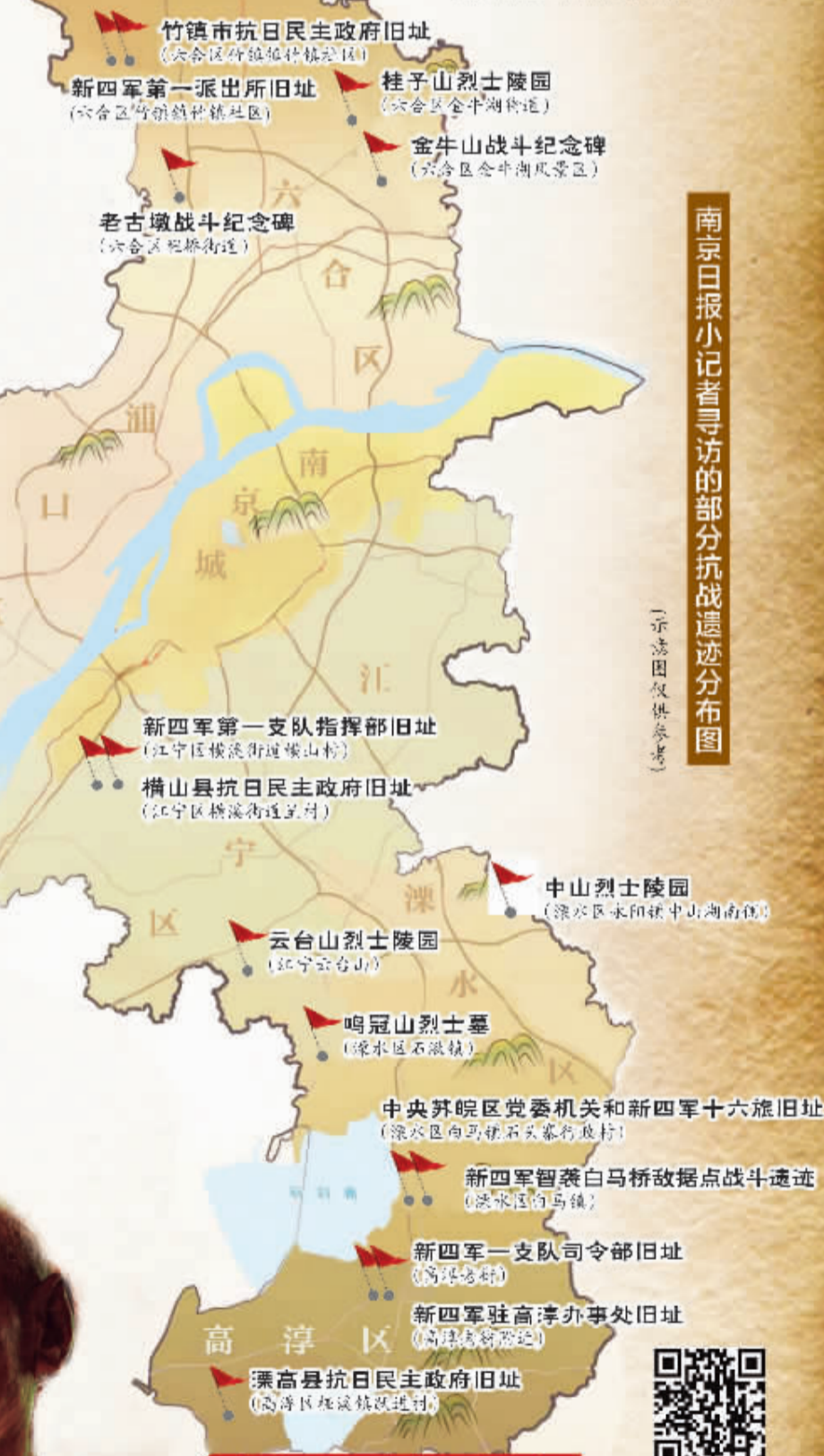
南京日报小记者寻访的部分抗战遗迹分布图 (示意图仅供参考)