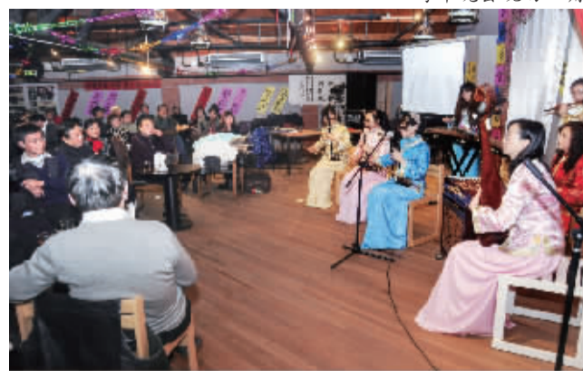
跨年晚会现场表演