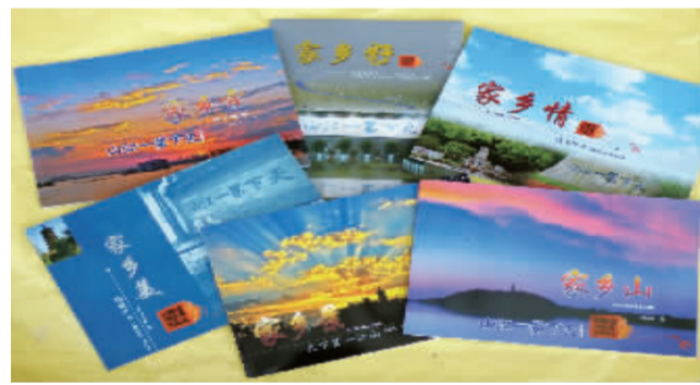
杨宪华家乡系列画册