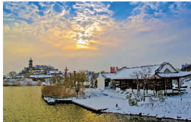
杨宪华摄影作品——雪后朝阳