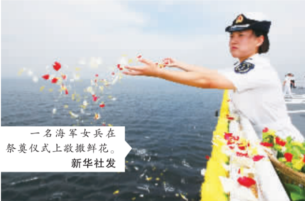
8月27日，海军在威海刘公岛海域举行甲午战争120周年海上祭奠仪式。新华社发