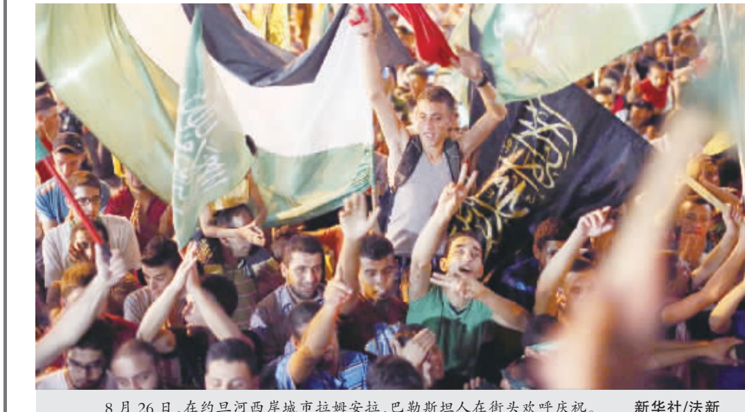
8月26日，在约旦河西岸城市拉姆安拉，巴勒斯坦人在街头欢呼庆祝。