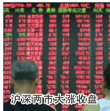
沪深两市大涨收盘

发116线，至110116开关；10kV 粉末115线 116线：唐驾庄部分、高资集镇部分、金家边部分、巢凰村部分、陈丰村部分、常石刚装、德祥机械、丰泰化验、高唐机械、巢凰采石场、恒昌食用油、恒鑫五金、嘉禾金属、金华普钢结构、金三立喷漆、金通机械调剂、京沪高铁搅拌站、牙油路桥、普济石粉厂、汽车半挂配件、勤丰饲料、荣恒机械、顺达水泥机械、唐驾庄铁砂厂、天润塑胶、万海建材物资、循环电源、高达机械、镇江制刷厂、昕宇药业、亚明弹簧带钢、中铸耐火、志春建筑、中信重钙粉、筑科金属、浣士金属； 115线：扬子粉末有限公司 7月24日 7:00-15:00 10kV 加工区I 12511以下；10kV 加工区II 12611以下； 125线：剑乔科技、赛锡科技、盛达光电、新安建材(二)、镇江新安建材厂、大港建材物资、循环电源、高达机械、新城投资管理有限公司、新刻鑫铸钢、正壹能源、塑管厂、纪庄； 126线：中小企业园临时用电、港发临时用电、经发公司中节能临时用电、大港股份扬子江路临时用电、镇江市水业总公司、耐丝电房、磁源照明