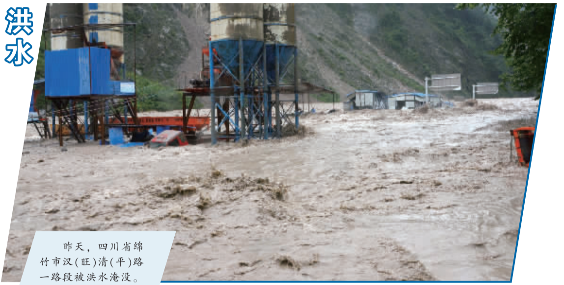
昨天，四川省绵竹市汉(旺)清(平)路一路段被洪水淹没。