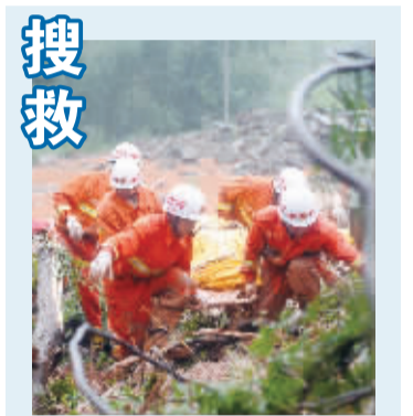
昨天，消防队员在四川省都江堰市中兴镇三溪村滑坡现场运送遇难者遗体。

针对“苏力”即将登陆我国的严峻形势，国家防总11日启动防汛Ⅱ级应急响应，并要求有关省市和相关部门根据防汛防台预案启动相应等级的应急响应，把各项工作做在前头，把各项措施落到实处，全力保障人民群众生命安全，最大程度减少台风灾害损失。福建省11日8时启动防台风Ⅱ级应急响应，浙江省于11日8时30分启动了防台风Ⅲ级应急响应，要求各地做好船只进港、人员上岸等各项防御准备工作。