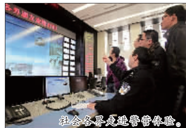
社会各界邀请民警体验警务工作水平、更惠民,一批群众反映的突出问题得以现场办公解决,赢得了民心。

根据公安部和省厅的统一部署,精心组织开展“大走访”开门评警活动,全市4000余名公安民警以不同形式走进城乡社区,走访千家万户,敞开心扉听民意,敞开心扉听民声,在传递党和政府温暖的同时,自觉接受群众评议。活动中,全市公安机关共走访单位7091个,家庭户37644户次,征求各类意见建议2071条,整改具体问题1132件,化解各类矛盾纠纷8840起,向困难群众慰问捐款合计120余万元。“大走访”开门评警使