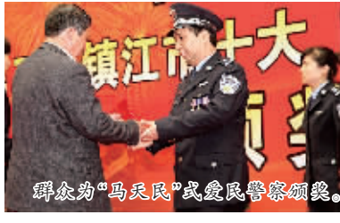
的征途上,用生命书写了人民警察的光荣,他们以实际行动践行了“忠诚、奉献、务实、创新”的江苏公安精神。(张杰)

功、为党旗添彩”主题教育实践活动,优秀警队、先进典型不断涌现,全年共有80个集体、991名民警受到记功、嘉奖等表彰。9月下旬开展由群众评选心目中的“十大马天民式爱民警察”活动,20名基层一线的民警得到500余万张选票,最终周海忠等10人荣获第二届镇江市十大“马天民”式爱民警察称号。新区公安分局积极推行的“代理家长”荣获“江苏省十佳青年志愿者服务项目”称号。5名丹徒公安民警牺牲在“亮剑”行动