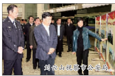
刘云山视察市公安局。

录像,并捕捉到嫌疑人影像,随即翻拍上传至梦溪论坛“网上警务专栏”。5日下午,另一网民在市区发现该嫌疑人,七里甸派出所闻警而动,将准备逃离的嫌疑人李某擒获。 【全景扫描】 科学用网管网,是创新社会管理形式,探索运用互联网时代信息传播的新方式。2011年,我市警方相继开通、运行了公安微博、网上警务专栏等网络警务新平台,实时与网民互动交流,广泛收集网络社情民意和有价