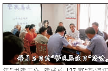
每月5日的“警民恳谈日”活动。

“警民恳谈日”活动,警民之间不拘形式交流互动,有力推动了民生警务,全年共组织各种形式的警民恳谈活动12次1704场次,与3.4万余名群众面对面交流,征求群众意见建议1750余条,为群众办好事、办实事、解难事4200余件。围绕服务经济社会发展,在全市出入境、治安、户籍、交通、消防等公安窗口推出了网上办事服务项目,实现网上受理、审批、查询、反馈“一站式”服务,群众足不出户即可办成事。深入推进“新镇江青