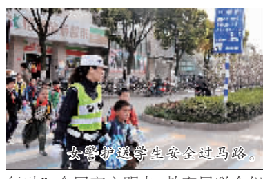
女警护送学生安全过马路。

通”,进一步加大道路交通管理力度,强化源头监管,着力提升事故预防水平,全年共查处各类交通违法行为120万起,道路交通事故“四项指标”数分别下降18.97%、9.75%、20.59%、29.55%。先后组织7万余人次志愿者参与交通执勤,提高市民遵守纪律的自觉性。强化疏堵保畅,在市区41个三岔路口及28个四岔路口采取了“右转弯不控制”的交通管理措施,在7条主干道的89个道路路口实行高峰时段“禁左”管理。扎实开展“护学