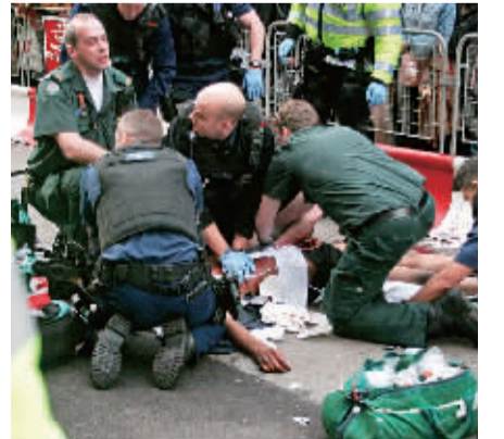
12月26日,在英国首都伦敦的商业街牛津街,警察和救护人员试图抢救受害者。当天下午1时45分左右,一名18岁男孩在牛津街被刺,当场死亡。另一起事件发生在当天18时,另一名男子同样在牛津街被刺受伤。另外在曼彻斯特街头,一名年轻人被枪杀。