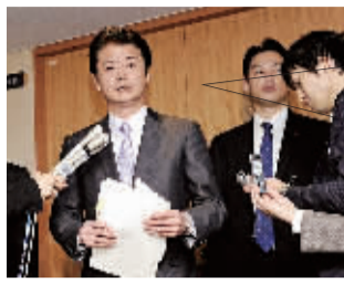
12月27日,在日本首都东京,日本外相玄叶光一郎在日本政府决定大幅放宽武器出口后在其官邸接受记者采访。

日本政府27日召开安全会议,同意放宽武器出口限制,允许日本参与武器研发和生产的国际合作以及以人道与和平为原则的国际援助。内閣官房长官藤村修说,放宽武器出口限制后,日本政府将通过约定等方式,严格管理武器出口,以避免违背初衷的其他用途。