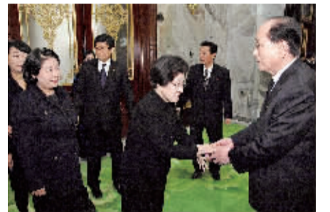
朝鲜最高人民会议常任委员会委员长金正永(前右)当天在平壤万寿台议事堂会见了韩国已故总统金大中的夫人李姬镐(前中)和现代集团前会长郑梦宪的遗孀、副会长玄贞恩(前左)一行。

据朝中社19日报道,朝鲜最高领导人金正日17日逝世。金正日逝世后,朝鲜成立了国家治丧委员会,决定将12月17日至29日定为哀悼期,从20日至27日接受吊唁,在28日举行告别仪式后于29日举行中央追悼大会。