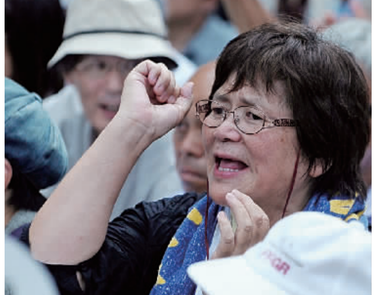
9月19日,在日本东京明治公园,民众呼吁反核电。

当日,约 5 万人在日本东京明治公园举行反核电集会和游行。会场内人山人海,市民团体和非政府(NGO)组织的代表在集会上发表演说,主张放弃核电。在集会后的游行中,游行者们呼吁日本政府立刻关闭所有核电站,东京电力公司立刻关闭核电站。