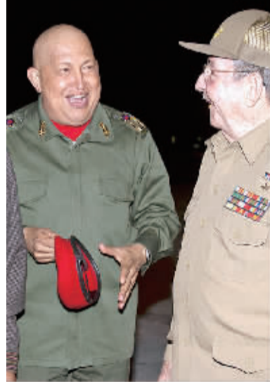
9月18日,在古巴哈瓦那的何塞·马蒂国际机场,古巴国务委员会主席劳尔·卡斯特罗(右)欢迎委内瑞拉总统乌戈·查韦斯。委内瑞拉总统乌戈·查韦斯 17 日晚前往古巴,准备接受第四轮化疗。 新华社发