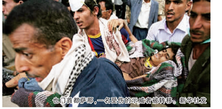
也门首都萨那,一名受伤的示威者被转移。

新华社电 也门数万名反政府示威者 18 日在首都萨那与政府安全部队发生冲突,导致至少 26 名示威者死亡,100 多人受伤。