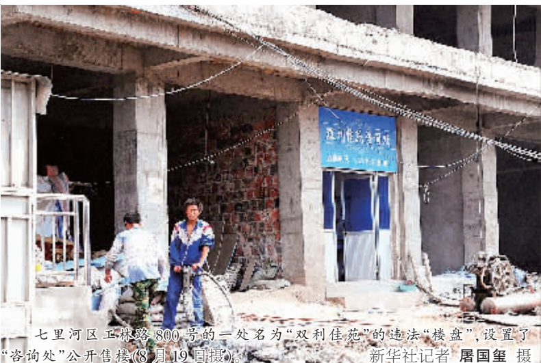
七里河区五里墩800号的一处名为“双利佳苑”的违法“楼盘”,设置了“咨询处”公开售卖(8月19日摄)。

日前一条“七里河的违章建筑能盖到十几层,最后就成商品房出售”的网帖引起网民的关注,许多网友称此现象在甘肃省兰州市七里河区存在已久。