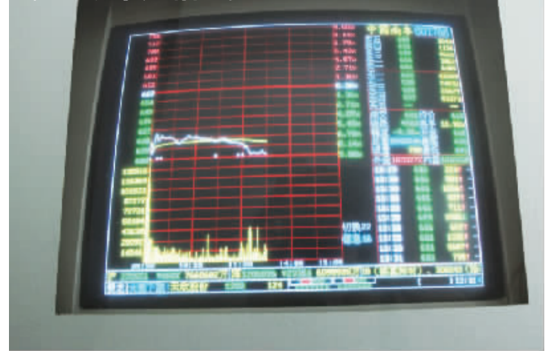
7月25日,上海某证券交易所营业厅电脑显示中国南车股票走势。