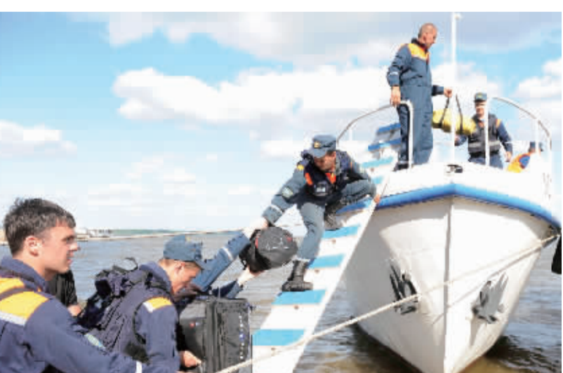
7月11日，在俄罗斯鞑靼斯坦共和国境内伏尔加河流域，救援人员登船前往救援现场。

从高处看，目前伏尔加河河面能见度较高。在离岸边约3公里处，数艘救援船正在现场进行救援工作。河面上不时有小型冲锋艇往来搜索。在离救援现场不远的河道上，停靠着曾经救起约80名乘客的客轮“阿拉别拉”号。据了解，“阿拉别拉”号是在现场候命，以便在需要时为救援工作提供帮助。沉船地点的附近水面已设置了禁行标志，但伏尔加河并未禁止通航，不时有游船