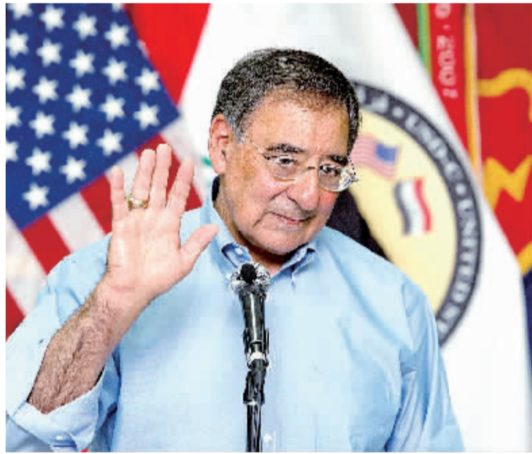
7月11日，美国新任国防部长帕内塔在伊拉克首都巴格达的一个军营对驻伊美军发表讲话。

帕内塔当天抵达巴格达进行访问，这是他就职美国国防部长以来第一次访问伊拉克。