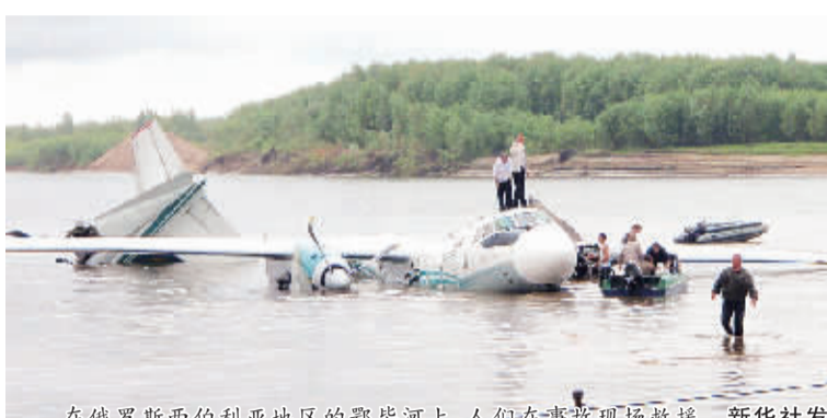
在俄罗斯西伯利亚地区的鄂毕河上，人们在事故现场救援。

过去几年间，全球发生多起安东诺夫—24型飞机失事。这种机型半个世纪前投入使用，如今仍有数百架在非洲和欧洲地区执飞。