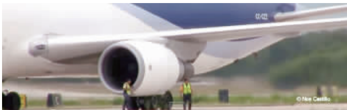
原版视频中并未发生“吸人”事件