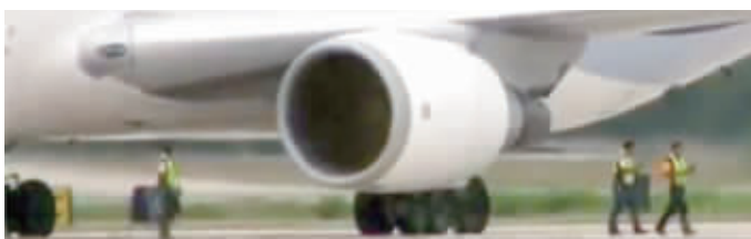
网传视频中“被吸者”(左)