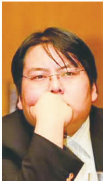
海鑫集团掌门人李兆会