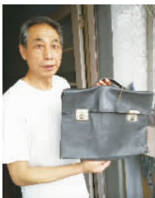
解鑑章手拿父亲使用过的包。