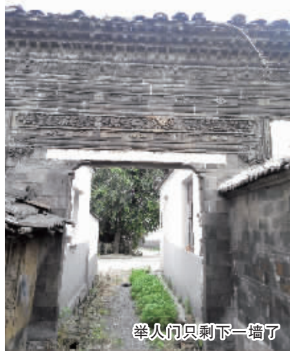
举人门只剩下一墙了