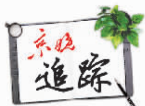
多处涵洞积水 困住私家车 3

士表示感谢,对四院医护人员及医疗专家的全力抢救和人文关怀表示感谢。他同时希望有关部门对涵洞存在的安全隐患采取必要的措施,驾驶人员也要吸取教训,防止类似悲剧的发生。(记者 曹海滨)