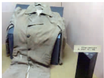
韦岗战斗缴获的战利品:军大衣、银元(以上均为资料图片)